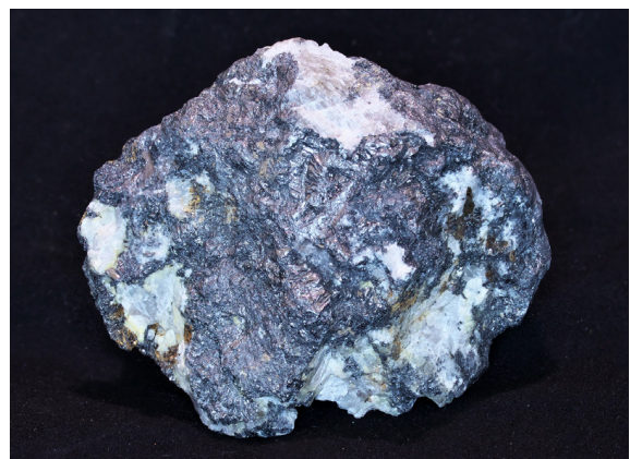
Рис. 4. Кварц-полевошпат-графитовая руда с высоким содержанием Au, Ag и Pt. Рудопроявление «Филинское», Приморье. № образца: 59/15. Размер: 9×7×7. Коллекция В. П. Молчанова, Д. В. Андросова. Фото Т. Б. Князевой

Комплекс попутных высокотехнологичных металлов выявлен в золотоильменитовых россытях , пространственно и генетически связанных с Ариадненской интрузией (правобережье р. Уссури) ультрабазитов, яв-