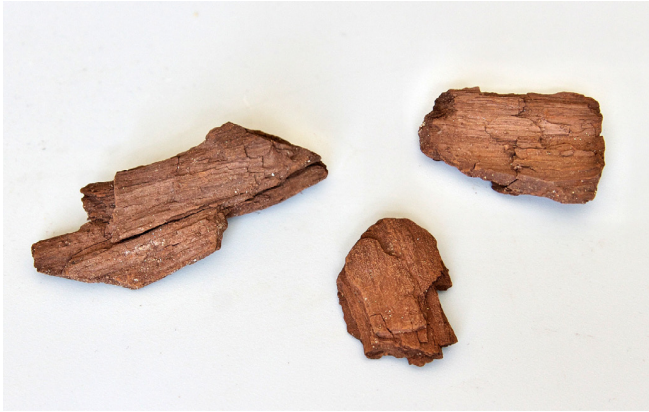
Рис. 7. Лигнитизированная древесина с содержанием германия 5 % (в золе). Павловское бурогольное месторождение, Приморье. № образца: 39/21. Размер фрагментов в среднем: 5×3×1. Коллекция И. Ю. Чекрыжова.