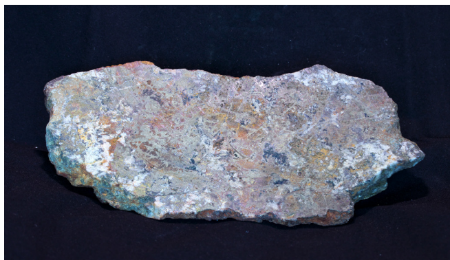
Рис. 5. Фрагмент сульфидно-карбонатно-кварцевого прожилка с золотовисмутовой (Au-Ag-Bi-Cu-As-Co) геохимической ассоциацией. Малиновское медно-золотое месторождение, Приморье. № образца: 19/88. Размер: 20×9×4. Коллекция К. Н. Доброшевского.

Золототурмалиновый тип минерализации , ранее неизвестный в Приморском крае, выявленный на месторождении Малиновское , пространственно и генетически ассоциирует с «редкометалльным» гранитоидным магматизмом. Изучение вещественного состава и геохимических особенностей руд (рис. 5) позволило установить корреляционные связи между элементами, причины их возникновения и разработать минералого-геохимическую модель месторождения, позволяющую определять уровень эрозионного среза рудных тел и давать оценку их перспективности. Установлено, что наиболее продуктивной на месторождении является золотовисмутовая (Au-Ag-Bi-Cu-As-Co), менее — золотовольфрамовая (W-Au-Ag-Cu-Bi-As) геохимические ассоциации [1, 2, 11]. По комплексу признаков руды Малиновского медно-золотого месторождения очень близки к рудам крупных по запасам месторождений Забайкалья и Амурской области (Ключевское, Дмитриевское, Кировское, Дарасунское и др.)