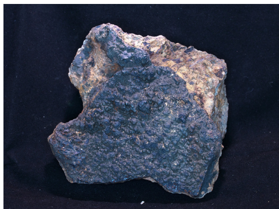
Рис. 6. Железомарганцевая (голландитовая) Co-Ba-Pb-корка из зон аргиллизации. Павловское угольное месторождение. № образца: 26/19. Размер: 10×9×3. Коллекция С. О. Максимова. Фото Т. В. Князевой

На объектах Южного Приморья с проявлением кайнозойских вулканических процессов обнаружено массовое образование кобальтоносного железомарганцевого вещества в виде микрокорок и стяжений (рис. 6) [3]. Высокие концентрации Co, Ni, Pb, Cu, Se определены в железомарганцевых континентальных первично-коллоидных новообразованиях, по морфологическим особенностям и элементному составу подобных океаническим кобальтомарганцевым коркам. Происхождение железомарганцевого оруденения в океанах исследует-