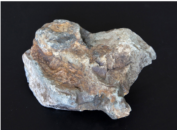
Рис. 2. Апоинтрузивный родингит пироксенового состава с гранатом, амфиболом, апатитом и цирконом по магматическим породам палеоценового комплекса. Выходы пород взрывных структур на Мокрушинской площади. № образца: 67/23. Размер: 10×10×4. Коллекция В. Т. Казаченко.

Впервые в Сихотэ-Алине обнаружены родингиты (рис. 2), содержащие золото-палладий-платиновую минерализацию и образовавшиеся флюидно-метасоматическим способом по основным и ультраосновным породам жерловой и интрузивной фаций палеоценового магматического комплекса [7]. Особенностью благороднометалльной минерализации в родингитах является присутствие в ее составе т. н. медистого золота, а также его ассоциация с соединениями Ni, Sb и S, самородными элементами, неупорядоченными твердыми растворами металлов и интерметаллидами [6].