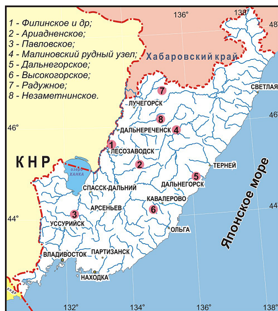
Рис. 1. Карта-схема размещения перспективных геологических объектов юга Дальнего Востока

На выставке представлены музейные экспонаты, краткая информация о месторождениях и результаты исследований ученых института, опубликованные в высокорейтинговых научных журналах и материалах конференций в 2016–2020 гг., в том числе поддержанные грантами научных фондов РФФИ и РНФ.