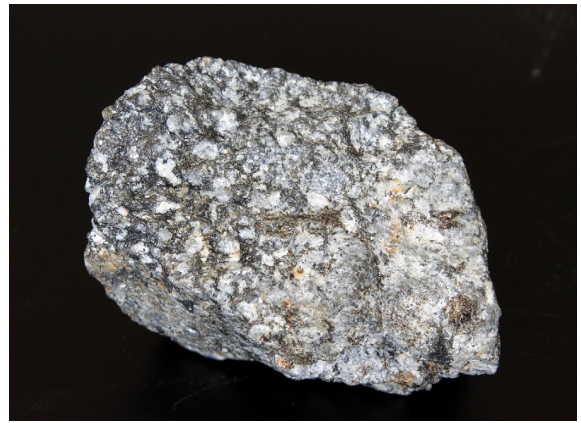
Рис. 3. Графитовая руда, обогащенная Au и Pt. Месторождение Тургеневское, Приморье. № образца: 59/14. Размер: 9×9×6. Коллекция В. П. Молчанова, Д. В. Андросова.

Высокоуглеродистые породы занимают обширные территории в пределах Дальнего Востока России. Только в Приморском крае они образуют широкую зону, вытянутую в субмеридиональном направлении на десятки километров. К этой зоне региональной графитизации приурочены два крупных месторождения — Тургеневское (рис. 3) и Тамгинское, разведанные еще в сороковых годах прошлого столетия. Как показали исследования авторов [12], графитовые руды, в строе-